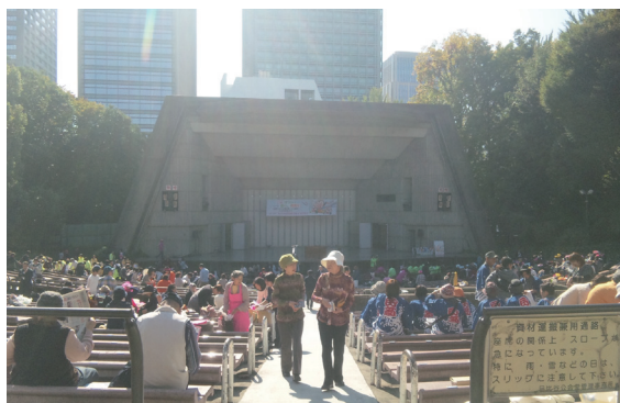
貴重な秋晴れに恵まれ、暑いくらいの陽気に

全国から業者婦人が集まり、想いを訴える「全国業者婦人決起集会」が10月26日に日比谷の野外大音楽堂で行なわれました。