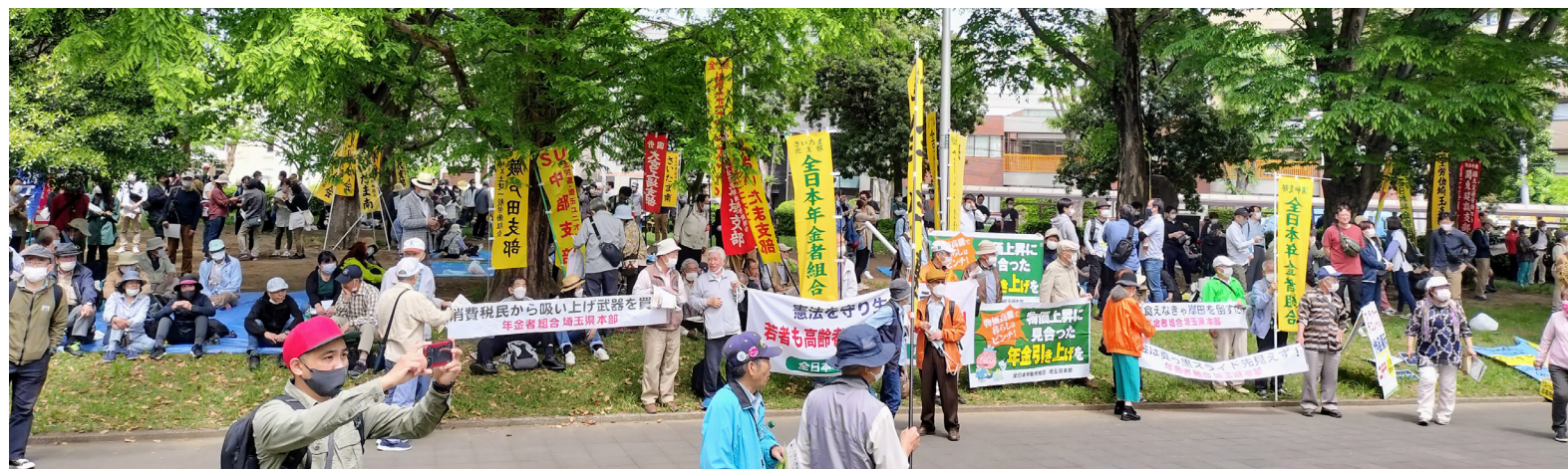
各団体ののぼりや横断幕が並び、にぎやかな雰囲気の中、北浦和公園。

5月1日のメーデーは、新型コロナがようやく落ち着いてきたこともあり、全国各地では久しぶりの大規模集会が開催されました。