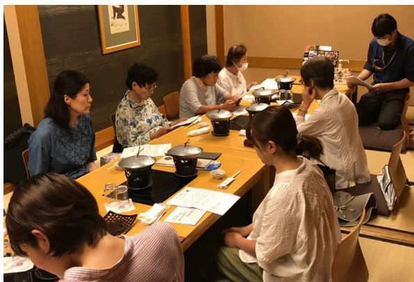
事務局の総会資料読み上げに耳を傾ける参加者

お店での会合は2020年の新年会以来です。久しぶりの会食に、初めての参加の人も多く、話が盛り上がりました。