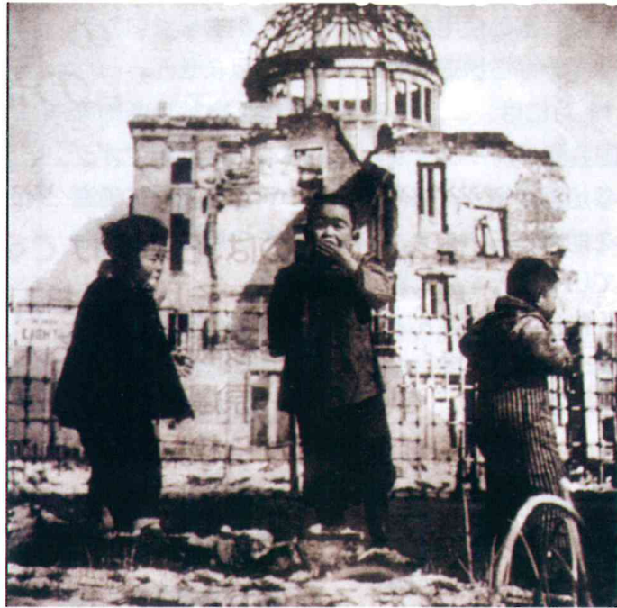
「原爆孤児」広島 雪を食べる子どもたち

原爆と人間展も27回をむかえました。世界から核をなくすため活動をつづけてきました。ウクライナへのロシアの侵略と核兵器の威嚇が繰り返され、我が国も大幅な軍事拡大が進もうとしています。唯一の被爆国である日本が核兵器廃絶を訴え、核兵器禁止条約に一日も早く批准することを願う、この展示で核兵器の恐ろしさと命の尊さを伝えていきたいと思えます。