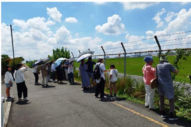
基地北東側の一般道路から、滑走路を間近に見ることが出来る

入間基地の見学後、一行は日高市下大谷沢にある豚のテーマパーク「サイボク」へ行き、昼食と買物を楽しみました。