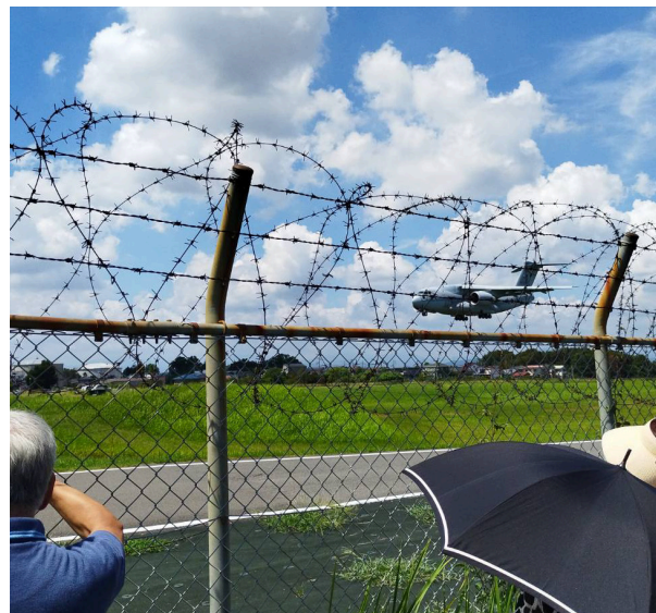
有利鉄線越しに見える、自衛隊輸送機の着陸

地まで移動。この日は快晴・無風の猛暑で、参加者は汗をかきかきヒューヒュー言いながらの移動となりましたが、滑走路や飛行機はとてもよく見え、基地のすぐ脇にある一般道路から、繰り返し訪れる自衛隊機の離発着を見学しました。